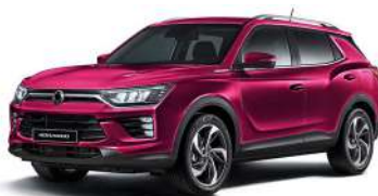
CHERRY červená (RAV)