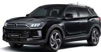
SPACE černá (LAK)