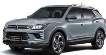
PLATINA šedivá (ADA)