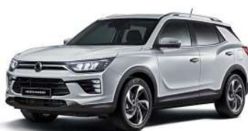
SILENT stříbrná (SAI)