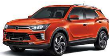
REDDISH oranžová (RAT)